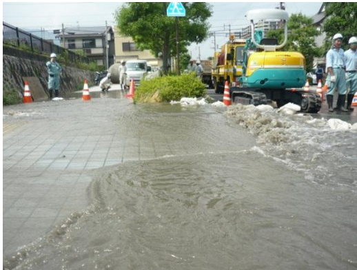
大津市御陵町水道管漏水事故状況

平成26年（2014年）6月26日（木）午後0時半頃に大津市役所前（大津市御陵町）の県道に埋められている直径50cmの水道管（1965年布設）が漏水し、多数のお客様にご迷惑をかけてしまいました。漏水の原因は、漏水箇所周辺の土が“腐食性土壌”といわれる土であったためであり、長い時間をかけて、少しずつ水道管の厚みが薄くなっていき、最終的に管内の水圧に耐えられず、約10cmの穴があき、漏水したものと考えています。