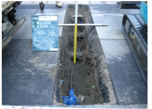
④ 各ご家庭の給水管の切り替え状況

切り替え対象となるお客様の給水管を古い水道管から新しい水道管に順次切り替えます。