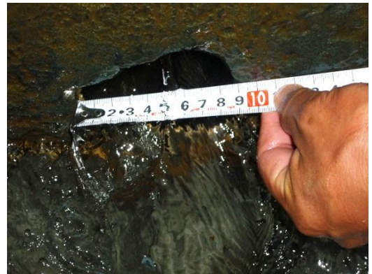
大津市御陵町水道管漏水箇所（約10cmの穴）