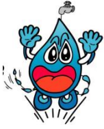
大津市水道事業 マスコットキャラクター 「テミイ」

平成26年（2014年）6月26日（木）午後0時半頃に大津市役所前（大津市御陵町）の県道に埋められている直径50cmの水道管（1965年布設）が漏水し、多数のお客様にご迷惑をかけてしまいました。漏水の原因は、漏水箇所周辺の土が“腐食性土壌”といわれる土であったためであり、長い時間をかけて、少しずつ水道管の厚みが薄くなっていき、最終的に管内の水圧に耐えられず、約10cmの穴があき、漏水したものと考えています。