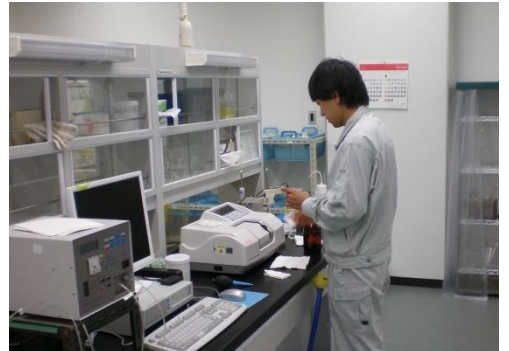
③ 水質検査の状況（企業局浄水管理センター）

布設が完了した水道管の水圧試験を行い、漏れがないことを確認します。水道管内の洗浄作業後、大津市企業局浄水管理センターにて水質検査を行い、水道管の安全性を確認します。