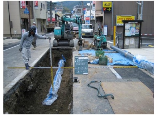
② 水道管の布設状況

道路を掘って、地中にある他埋設物（ガス管、電気・通信線など）の位置関係を調査し、設計どおりに工事が可能か調査します。