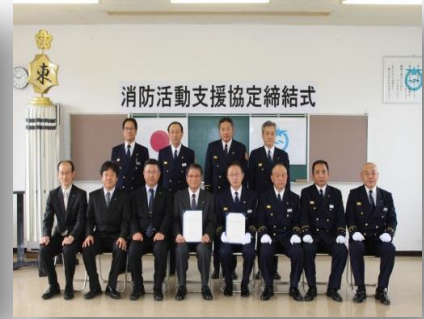
〈東レ株式会社瀬田工場〉