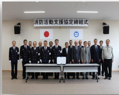
〈一般社団法人 滋賀県建設業協会大津支部〉