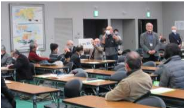
令和2年度第2回地域「人権・生涯」学習推進協議会会長会・事務局長会 研修会での様子

自治会加入の如何に関わらず、全ての住民が参加し、地域の課題をその地域で解決していく住民主体のまちづくりである。今後ますます成長していくであろう人権にどう向き合い、これからどう取り組んでいくのかについて、議論を積み重ねていかなければならない。