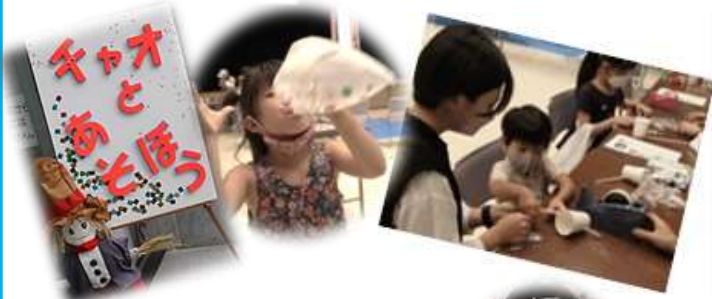
「チャオとあそぼう」