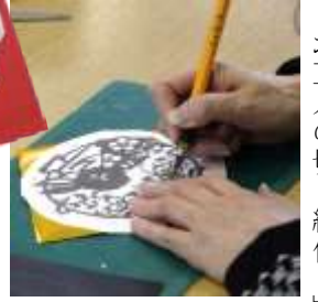
市民向け企画 「お正月の切り絵作り」