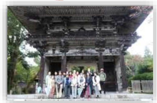
会員研修会 「三井寺 光浄院見学」