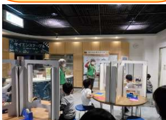
わくわくサイエンスの活動風景