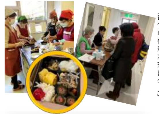
マナちゃんセミナー 「滋賀の伝統料理に学ぶ」