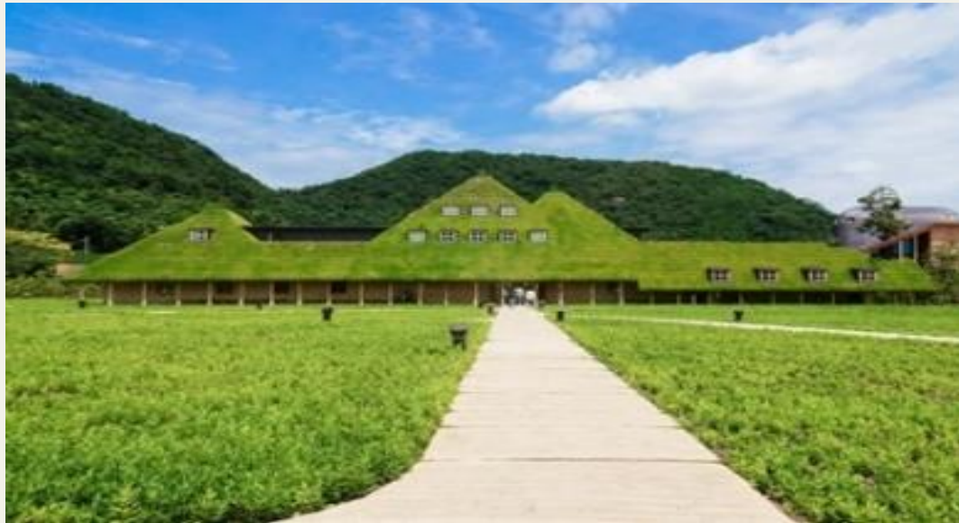
ラ コリーナ近江八幡