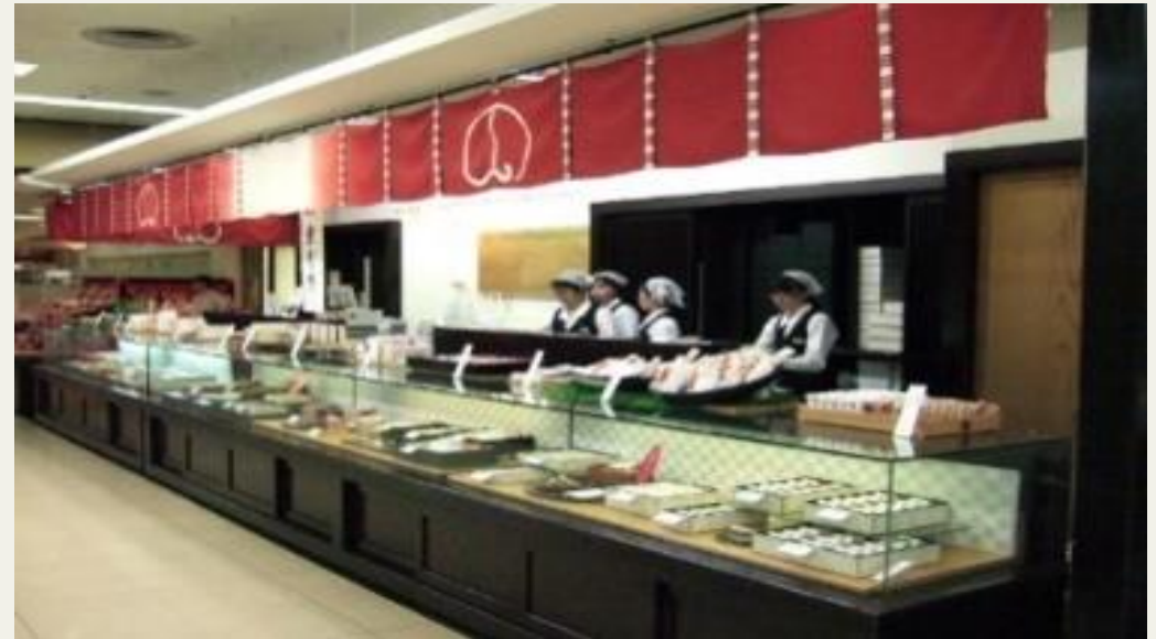
(旧) 西武百貨店大津店