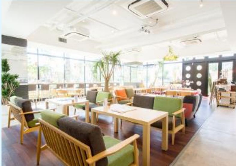
家カフェ + Garden