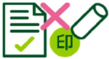
口座振替依頼書 + 印鑑

毎月納付書を持って支払いに行かなくていいので便利！ 申請しなくても毎年納付した金額のお知らせが届くので年末調整や確定申告にも便利！