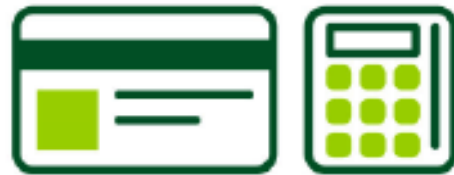
キャッシュカード + 暗証番号