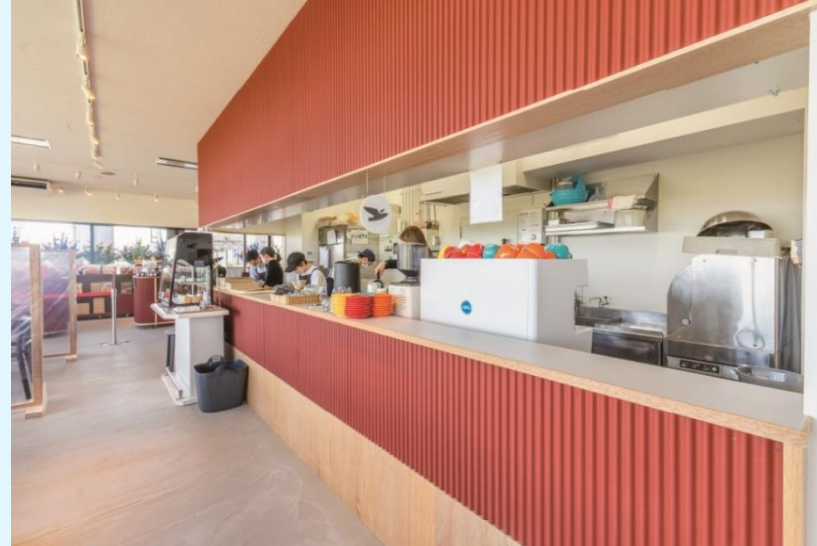
大津港サイクルステーション (Bird Cafe)