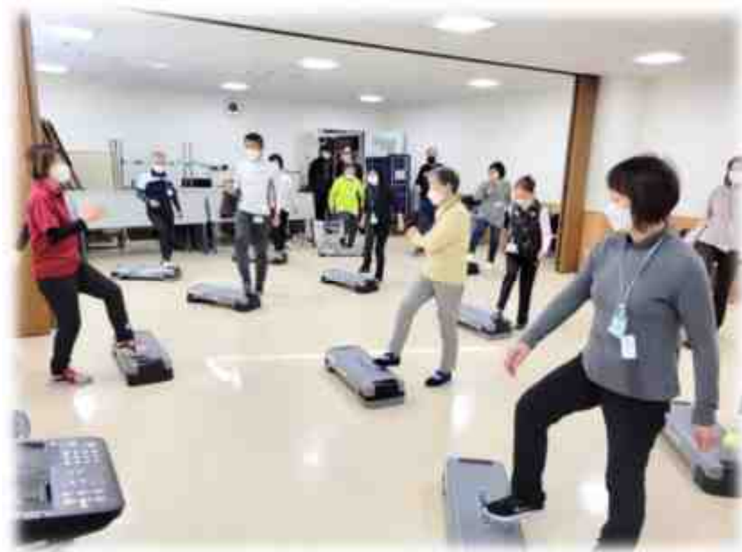
健康トレーニング教室の様子