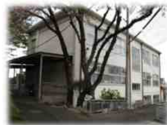
現 比叡すこやか相談所 坂本六丁目1-11 (京阪坂本比叡山口駅前)