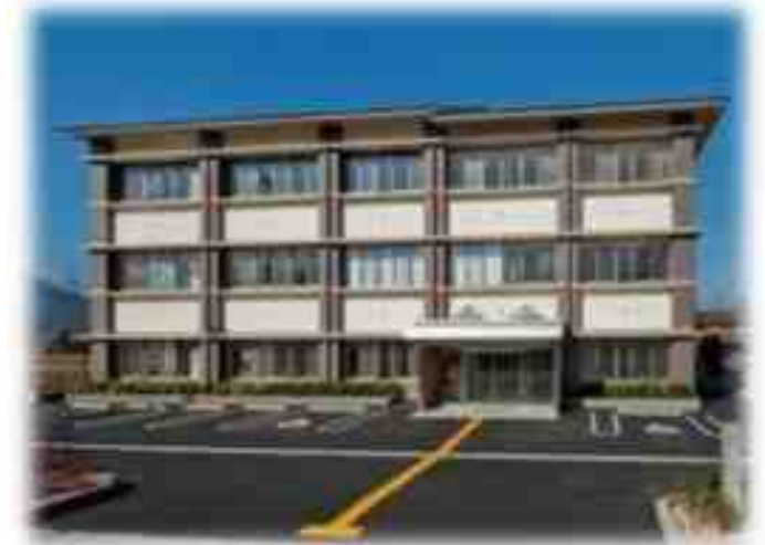
田上市民センター