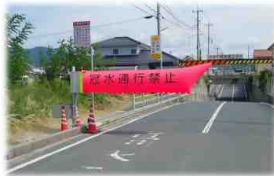
参考) (株)アドビック提供

本市の地形上、場所によっては現場まで距離があるため、冠水時の車両通行止め対応に時間を要し、また、市内で同時多発的に冠水が発生した場合、職員等の緊急対応要員の不足が課題となっていることから、その対応として、エア遮断機を設置する。