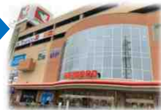
平和堂坂本店 坂本七丁目24-1