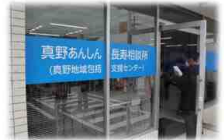
真野あんしん長寿相談所