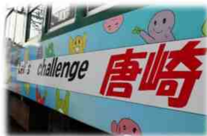
学校夢づくりプロジェクト