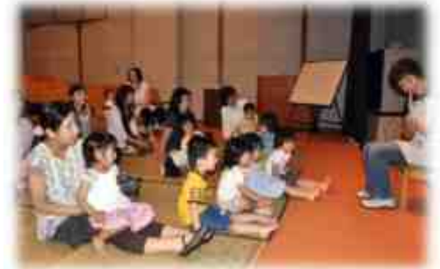
絵本の読み聞かせの様子