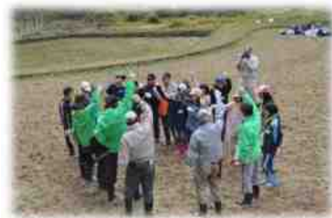
大津子ども環境探偵団の様子