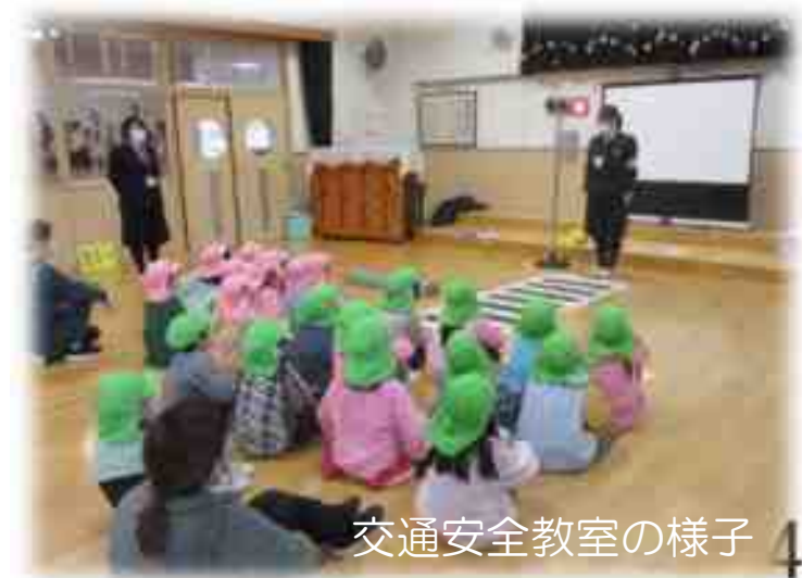
交通安全教室の様子 43