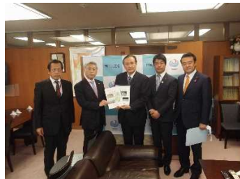
昨年度の中央要望の様子