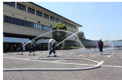
消防操法訓練大会