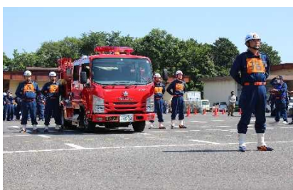
消防操法訓練大会