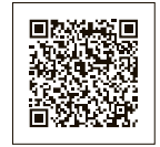
接種が 受けられる場所