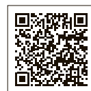
スマートフォン決済

個人市民税・県民税の税額決定通知書について 市民税課 ☎528-2721・2722 図クレジットカード納付、スマートフォン決済について 収納課 ☎528-2728・2729