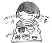
大津市食育推進キャラクター「おぜんちゃん」

食育は、生きる上での基本となるものです。食に関する知識を取得し、生涯にわたり健康で豊かな食生活を送ることができるように「食育」を推進しましょう！