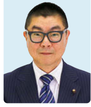
草野 聖地 (三井寺町)