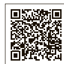
クレジットカード納付