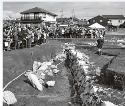
坂本城跡発掘調査現地説明会の様子

3月21日には、本市からの工事計画の中止の要請に対して深いご理解を賜り、事業者と「坂本城跡の国による史跡指定に向けた覚書」を締結することができました。今後、周辺の調査を進めるとともに、文化庁と協議を重ね、早期の国の史跡指定を目指してまいります。