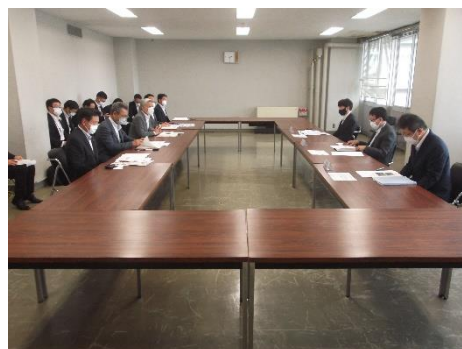
昨年度の近畿地方整備局への要望の様子