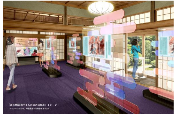
イラスト展示イメージ