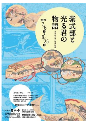
【夏】紫式部と光る君の物語