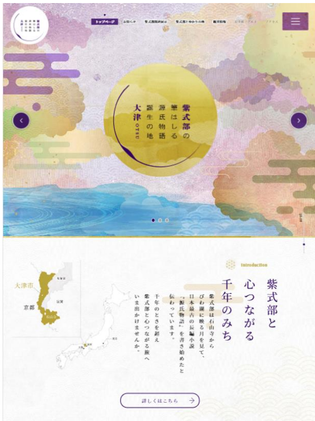
特設ホームページ：トップページ

特設ホームページでも紫式部関連展示の情報を本日26日より公開中です。今後の取組みについては特設ホームページのほか、X（旧Twitter）やInstagramでも発信予定。SNSでは「#光る大津へ」ハッシュタグキャンペーンも実施予定など、展示とあわせて大津を楽しむ企画を多数準備しています。お楽しみにお待ちください。