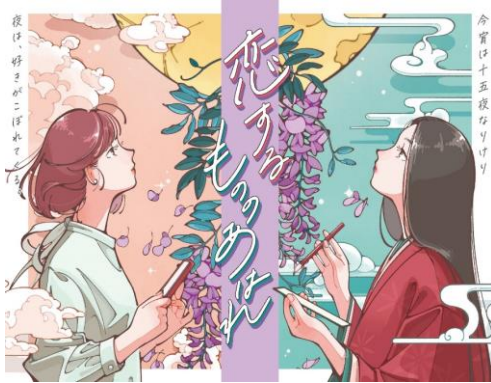
『源氏物語 恋するもののあはれ展』 キービジュアル