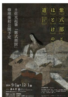
【秋】紫式部とほとけの道