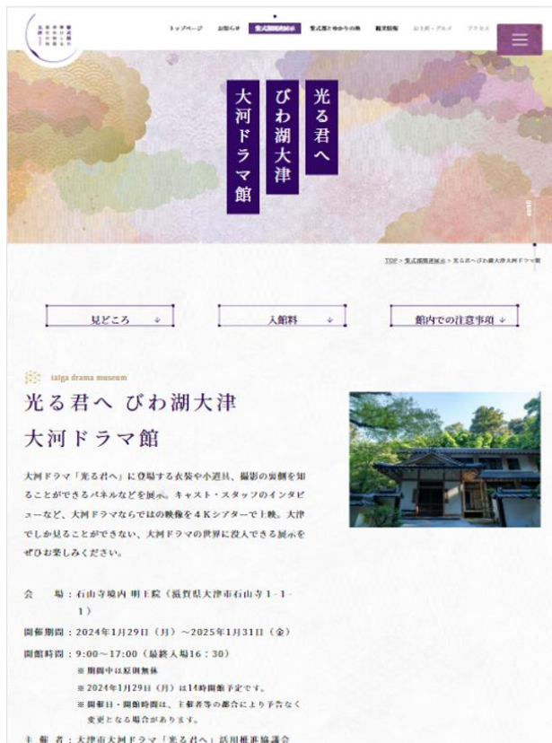
特設ホームページ：「大河ドラマ館」ページ