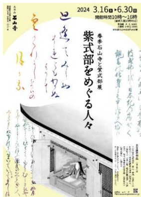
【春】紫式部をめぐる人々

『石山寺と紫式部展』では、紫式部や源氏物語に関連する石山寺所蔵の文化財を、3期に分けて約100点公開します。紫式部が源氏物語を起筆した際に使用したと伝わる硯石（伝紫式部料 古硯）はすべての期間中展示いたします。今後、紫式部の肖像画として有名な土佐光起筆「紫式部図」も修理後初公開予定です。