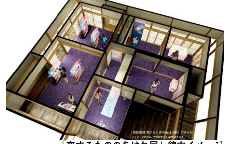
「恋するもののあはれ展」館内イメージ

平安時代の「恋」を体感できる企画展。『源氏物語』の和歌を現代的に表現した描き下ろしイラストなどを展示しています。色・香り・花など平安時代の文化に触れるコーナーもあり、ファーストサマーウイカさんとともに内覧します。