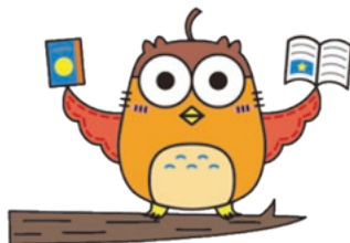
としよかんマスコットキャラクター“HOOT(ホー)”