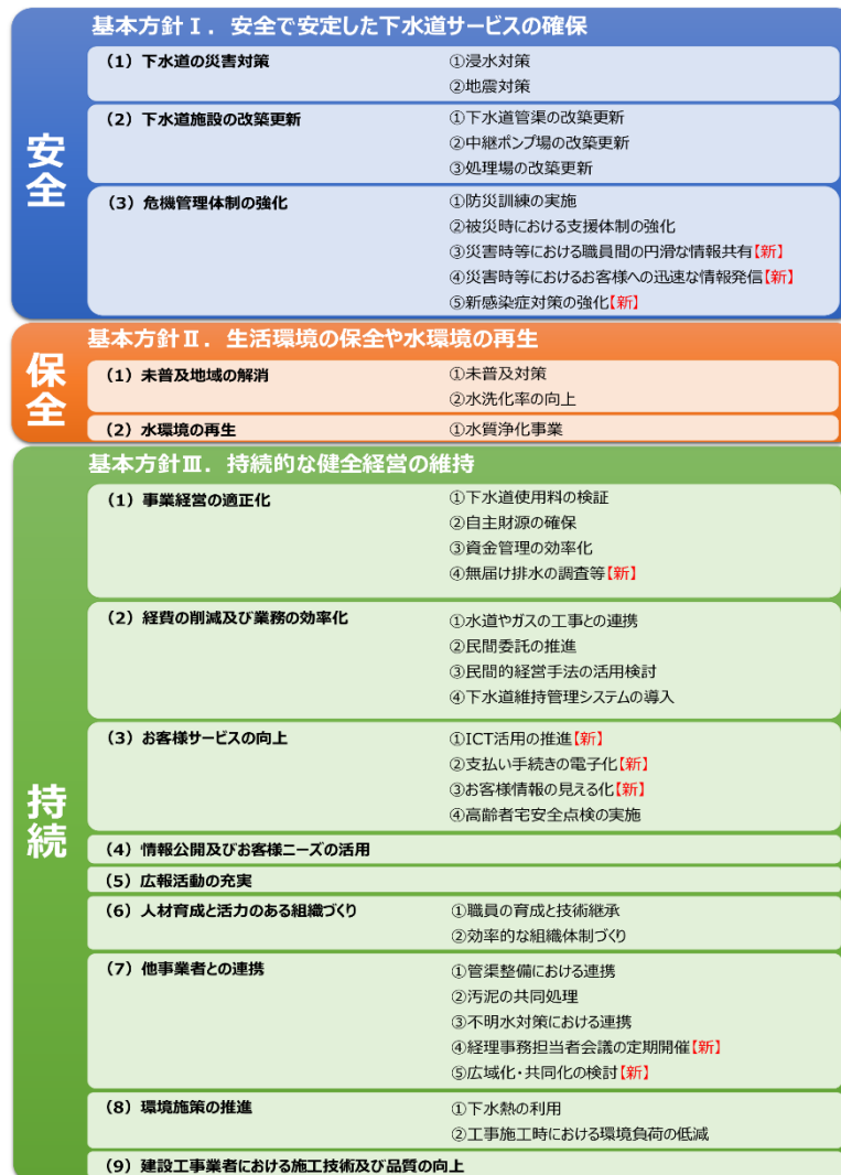
図表 4-16-2 下水道 施策体系図

出典：大津市下水道事業 中長期経営計画（経営戦略）【令和 2 年度改訂版】 概要版