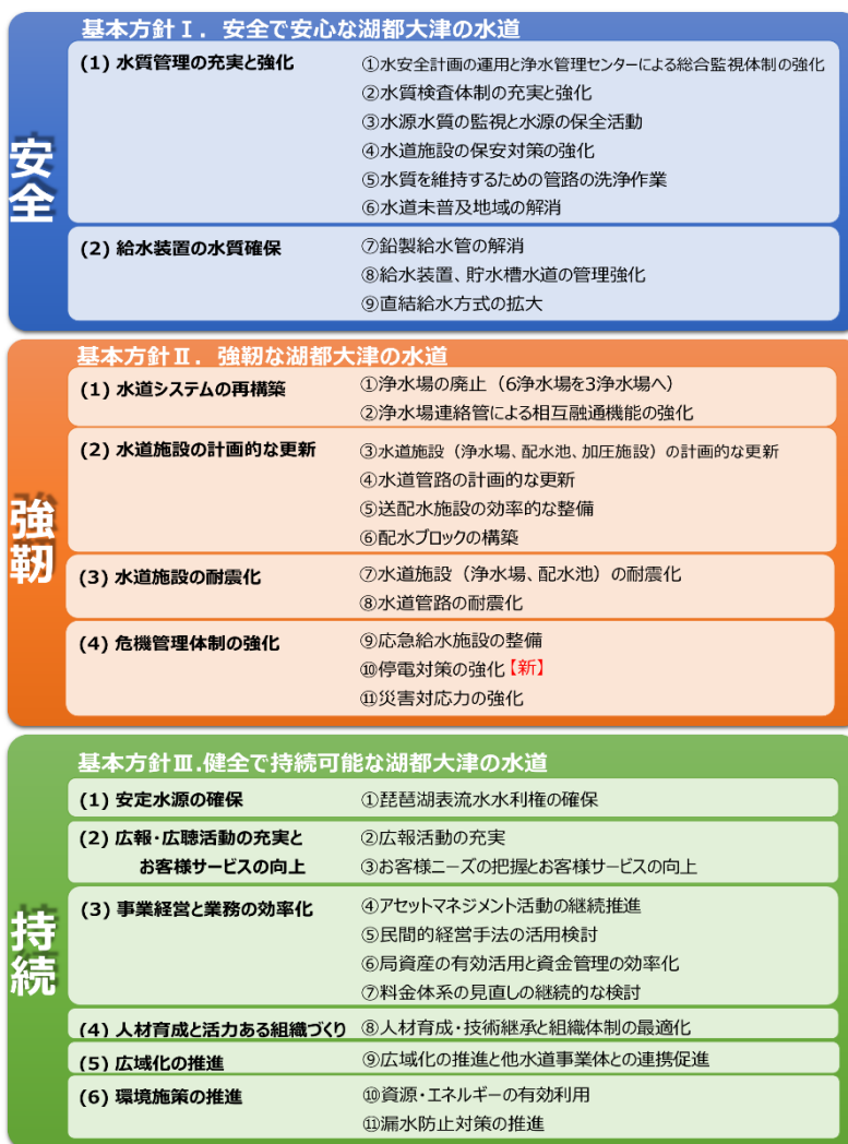
図表 4-15-2 水道 施策体系図

出典：湖都大津・新水道ビジョン 重点実行計画 中長期経営計画（経営戦略）【令和2年度改訂版】 概要版