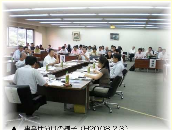
▲ 事業仕分けの様子 (H20.08.23)