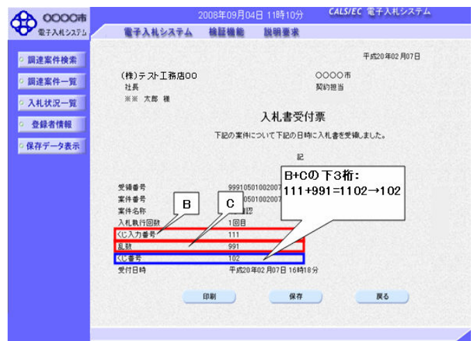
図1. 2. 入札書受付票