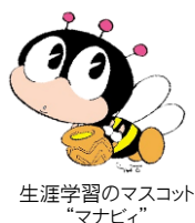
生涯学習のマスコット “マナビィ”