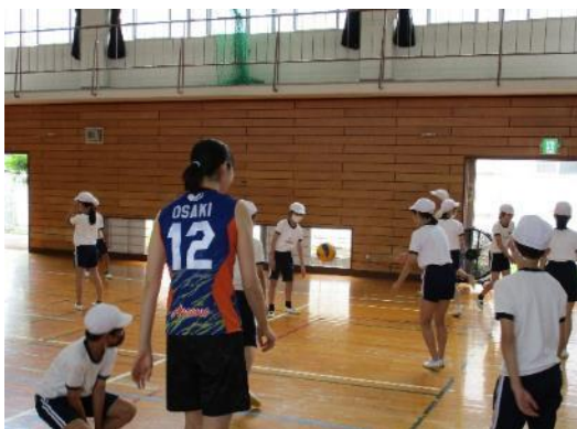
第1回 瀬田北小学校 6年生