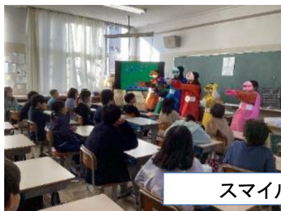
スマイルレンジャーによる啓発劇