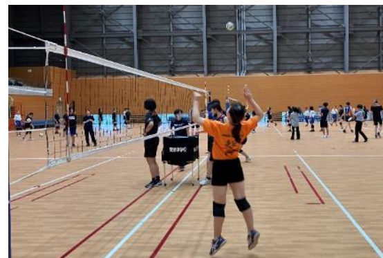
第3回 中学校バレー部(栗津中・北大路中・唐崎中)