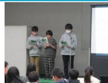
仰木の里小学校 里っ子ESDで魅力ある学校づくりとキャリア教育