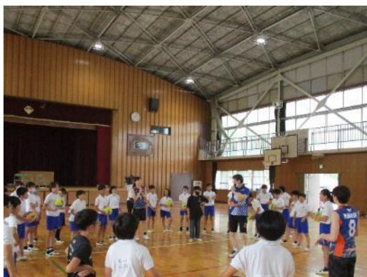
第2回 富士見小学校 6年生