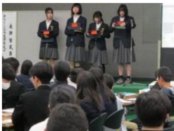
仰木中学校 地域に届け！仰木愛 ～仰木の魅力・誇りをお菓子に乗せて～