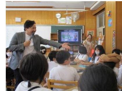
第3回 大石小学校5・6年生 今村翔吾氏