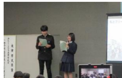
田上中学校 田上中ポイ捨てクリーンウォーク ～ともに汗して『ふるさと』を美しく～