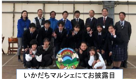
いかだちマルシェにてお披露目