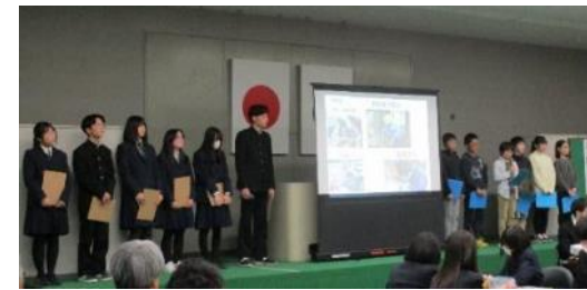
葛川小学校・葛川中学校 KCLプロジェクト