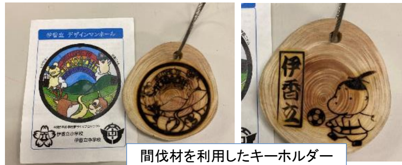
間伐材を利用したキーホルダー

地域の魅力を発信すべく、大津市企業局と連携しオリジナルマンホール蓋を制作。2025年国スポの女子サッカーの会場となる伊香立運動公園に設置し多くの方の目に触れる機会とした。また地域の間伐材を利用したキーホルダーにマンホール蓋デザインとおおつ光ルくんがサッカーをしているデザインを焼き印し「いかだちマルシェ」来場者に配布した。地域の魅力を創意工夫して発信できた取り組みであった。