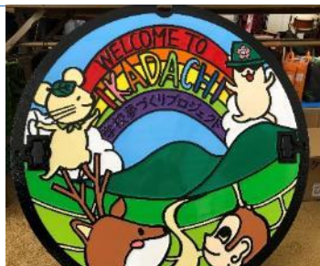
オリジナルマンホール蓋