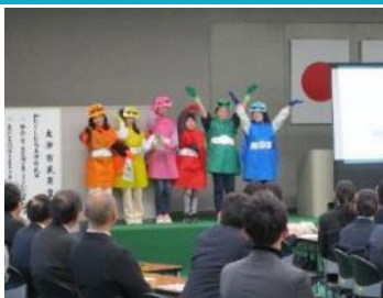
南郷小学校 笑顔いっぱい南郷小学校プロジェクト