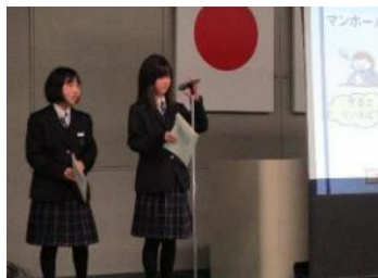
伊香立中学校 伊香立ブランディング～伊香立の魅力を発信～