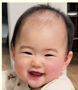
ひなちゃん (0歳9か月)