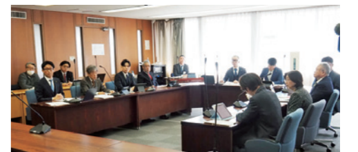
委員会審査の様子は こちらのYouTubeから (R8.3.16総務常任委員会)

討論では、「報酬の引き上げは、現職議員が責任を持って判断し、その結果については選挙というかたちで市民からの審判を受けるべきだ」との反対発言がありましたが、採決の結果、会議案を賛成多数で可決しました。