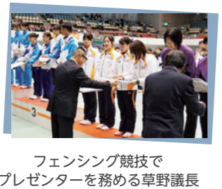
フェンシング競技でプレゼンターを務める草野議長

盛り上がると良いですね。副議長 今回の大会は、改めて大津市の魅力に気付くきっかけにもなりました」