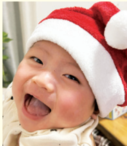
さくちゃん(0歳3か月)