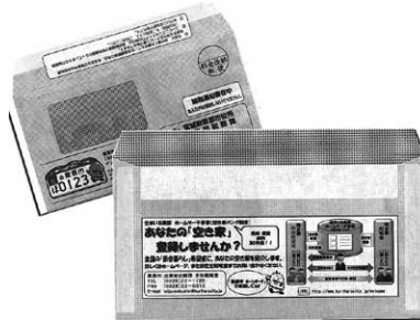
納税通知を活用した事例(宮城県栗原市)

グノートを活用した空き家発生を未然に防止するための啓発、空き家の活用・流通促進のための家財処分支援やリフォーム費用補助などは、空き家対策として有効と考えるが、見解は