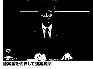
提案者を代表して提案説明

当該案は市民の理解が得られないとして、多くの議員が本会議 の一般質問などで取り上げてきたが、市は「より良い案になるよ うに努める」との答弁に終始。市議会の総意として、あらためて市長 に対し市民や地域に真摯に向き合った検討を行うよう求めた。