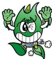
大津市企業局 ガス事業 マスコットキャラクター 「ガパス」

ガス管を道路に例えると、中圧導管というのは高速道路、低圧導管というのは国道や市道といった一般道路にあたるんだ。 中圧導管によって、各地域の主要ステーション（ガバナ）まで高い圧力で大量に運び、そこで圧力を落として、低圧導管によって皆さんの家やお店にガスを供給しているんだよ。