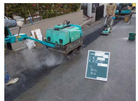
④ 道路舗装の仮復旧状況