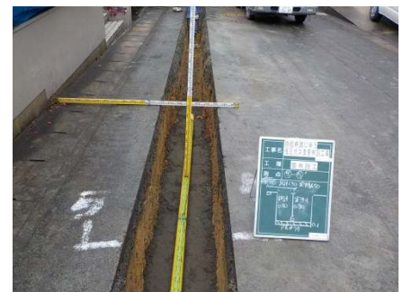
② ガス管の布設状況

埋め戻した部分の状態が安定するまでの期間を置いた後、舗装業者により施工前の道路状態に復旧します。