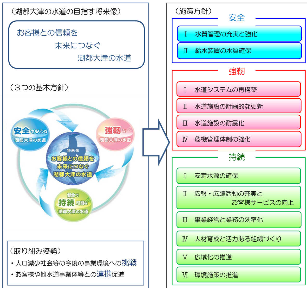
湖都大津・新水道ビジョン施策体系図

※1 水安全計画 WHO（世界保健機関）で提唱され、食品製造分野で確立されているHACCP（ハサップ）の考え方を元に、水源から給水栓に至る各段階で危害評価と危害管理を行い、統合的な水質管理を実現し安全な水の供給を確実にする水道システムを構築するための計画