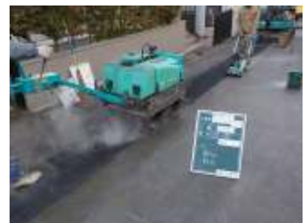
④ 道路舗装の仮復旧状況