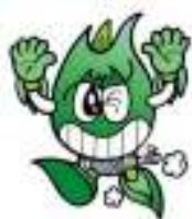
大津市企業局 ガス事業 マスコットキャラクター 「ガパス」

ガス管を道路に例えると、中圧導管というのは高速道路、低圧導管というのは国道や市道といった一般道路にあたるんだ。 中圧導管によって、各地域の主要ステーション（ガバナ）まで高い圧力で大量に運び、そこで圧力を落として、低圧導管によって皆さんの家やお店にガスを供給しているんだよ。