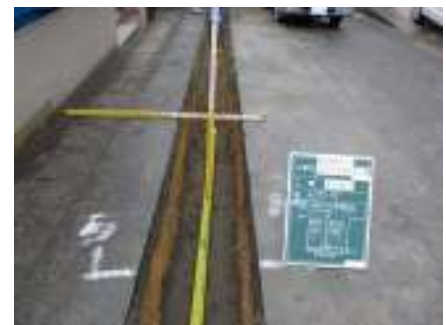
② ガス管の布設状況

埋め戻した部分の状態が安定するまでの期間を置いた後、舗装業者により施工前の道路状態に復旧します。