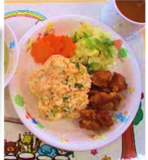
今年度のランチョンマット♪