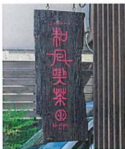
和風アンティークカフェ 喜一郎