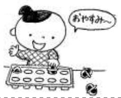
たまごパックに入れる