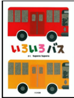
『いろいろバス』 tupera tupera・作

あか・き・みどり・・・ いろいろな色のバスから降りてきたり乗って 行ったりするあんなものやこんなもの・・・ 次は何か・・・と興味が膨らんでいきます。 子どもはもちろん大人も楽しめる本です。