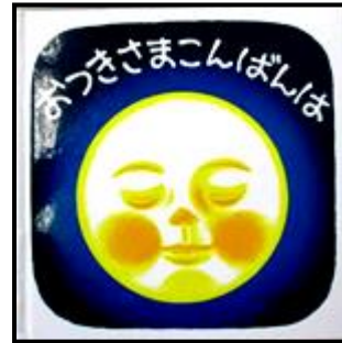
『おつきさまこんばんは』 林 明子・作

あか・き・みどり・・・ いろいろな色のバスから降りてきたり乗って 行ったりするあんなものやこんなもの・・・ 次は何か・・・と興味が膨らんでいきます。 子どもはもちろん大人も楽しめる本です。