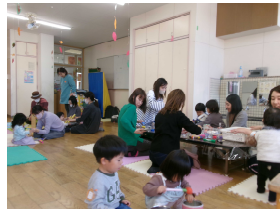
11月のスマイルの様子

2023年はたくさんの地域の方に朝日が丘保育園の子育て広場にご参加いただきました。2024年も地域の皆さんが楽しくそして繋がり合い、子育て仲間がほっこりと過ごせる広場にしていきたいと思えます。是非お子さんと一緒に気軽に遊びに来てください。お待ちしております。