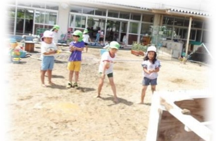
それ！力いっぱい、泥投げ遊び！