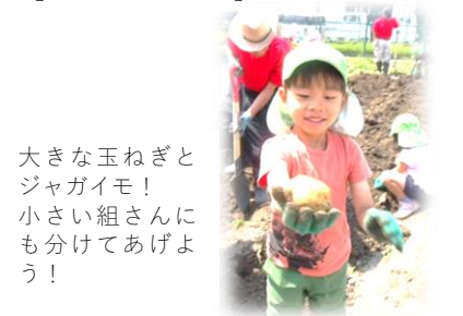
大きな玉ねぎとジャガイモ！ 小さい組さんにも分けてあげよう！