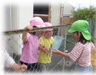
プールのオタマジャクシ取り。 「見て！とれたよ！」

大きな玉ねぎとたくさんのジャガイモが穫れました。一つの種芋からいくつもジャガイモができたこと、重くて運ぶのが大変だったけれど、友達と力を合わせて運べたことなど嬉しい体験でした。各家庭に持ち帰り「僕が育てたんやで！」「どうやって食べようか？」とご家族の方が子どもたちの声に耳を傾け、会話が弾んだことと思います。自分たちで育てた野菜を収穫する経験は、様々な気付きや喜び、驚きがあり、食への関心を高めるとともに、いのちの大切さや自然の恵みへの感謝の気持ちが育まれています。時間や手間がかかるけれど、気持ちを寄せて子どもたちと共に楽しみたいと思います。