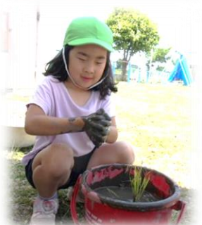
バケツ田んぼにも挑戦中！