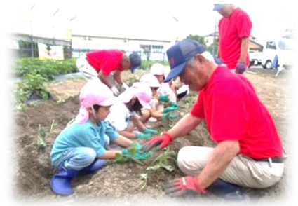
サツマイモの苗植え。3歳児は、4・5歳児のしていることに興味津々で、「がんばれー」「おいしくなーれ」とエールを送ってくれました。