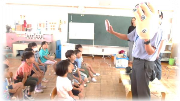
大津食品衛生協会さんによる手洗い教室。4・5歳児は手洗いマスターに認定されました。