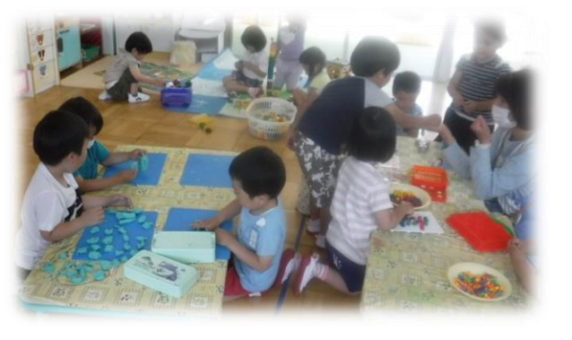
午後からのゆったりした時間