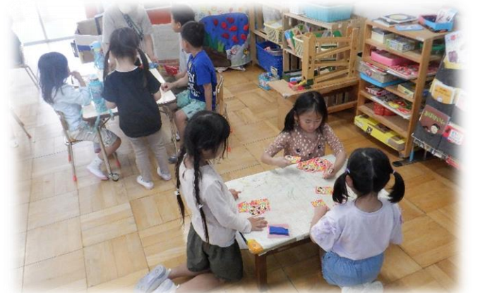
預かり保育の様子