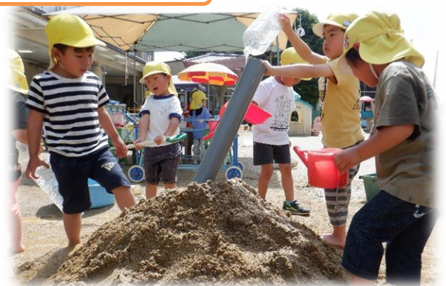
自発的な活動としての遊び