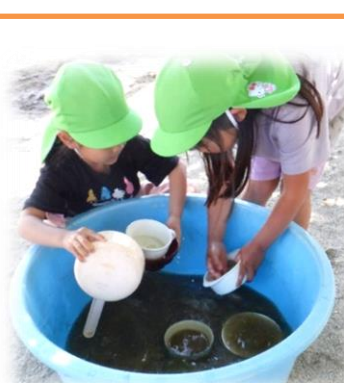
力を合わせて片付け