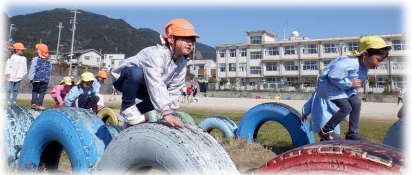
豊かな地域資源を生かした活動