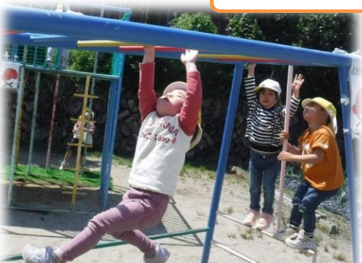
自分の目標に向かって挑戦