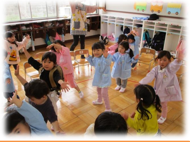
学級でまとまっている遊び