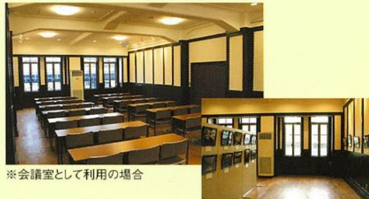
※会議室として利用の場合