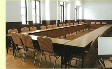
※2室をつなげて利用の場合