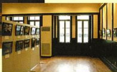
※ギャラリーとして利用の場合