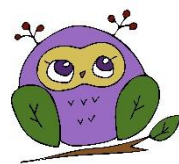
マスコットキャラクター ふじみん