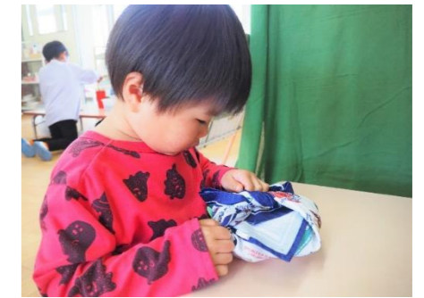
「僕は、今日も自分でできたよ!」

お弁当の風呂敷包みのやり方を伝え合っています。 〈先生→子ども〉の教える関係性も必要ですが、 〈子ども→子ども〉 〈子ども⇄子ども〉という関係性も大切にしたいですね。