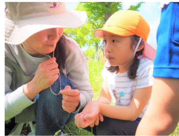
「ぷーぷー」「すごいね！音が出たね！」

豆ひとつでも個体差があります。見て触って選ぶことから遊びが始まります。作ってみて破れたり、音がかすれたり失敗することを繰り返しながら進めていきます。これが折れない心「レジリエンス」を育てていくひとつとなります。