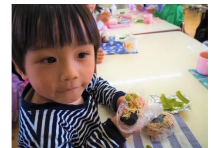
「おにぎりにトッピングしてみました!」

種まき、水やり、草引きを経て、収穫、実食と栽培活動の一連は長いですが、子どもたちの心に大きく実る取り組みになっています。