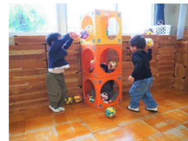
いっぱい入れたい兄さんたちといっぱい出したい弟…。

道路の縁石の上を歩こうとしたり、横断歩道の白いところだけ跳んでみたり、タイルのマス目を桂馬跳びに進もうとしたり…、そんなところから生まれるものもあります。ですので、そんな遊びをぜひ幼稚園で大いに取り組んでほしいと願っています。