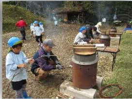
かまどに木をくべよう！