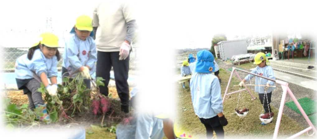
手作り天秤で重さ 比べ、面白い！