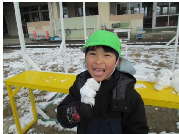
アイスクリームみたいでしょ♪ 冷たいよ～(๑)~

その時にしかできない遊びを逃さず に。予定を変更して雪遊びを存分に☆ 手で触って、冷たさやしゃりしゃりした 感じなどの感触や重さなどを感じなが ら遊べました。