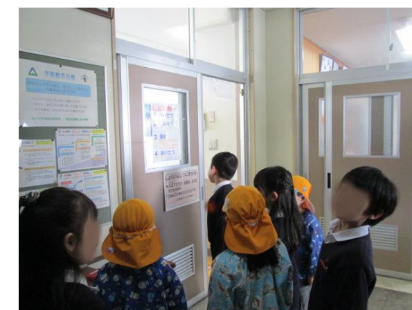
職員室に案内してもらいました。机がいっぱ い!ちょっとドキドキ♡