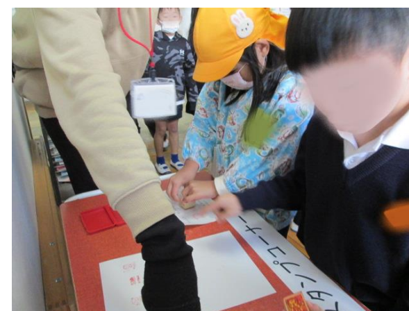
スタンプラリーで楽しみながら学校を案内し てもらいました☆