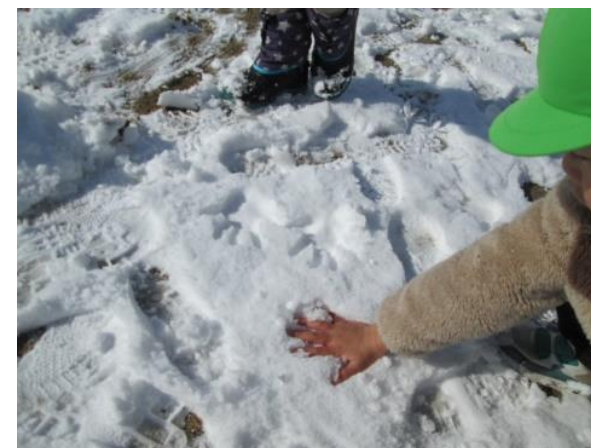
ぎゅっぎゅっぎゅっ。 見て見て手形できるよ～。