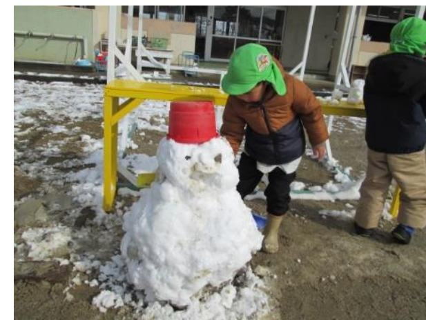
バケツの帽子と石で目、鼻をつけて。 雪だるま完成～!!!