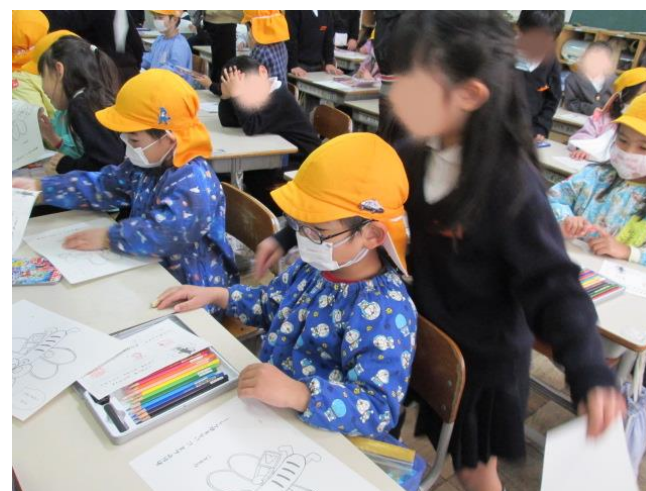
簡単な授業の体験もさせていただきました。 あおやんまの塗り絵もある！