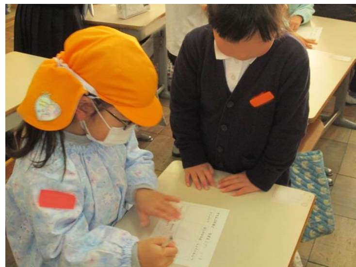
1年生の教室で机と椅子に座り、1年生が 横についていろいろ教えてくれました。