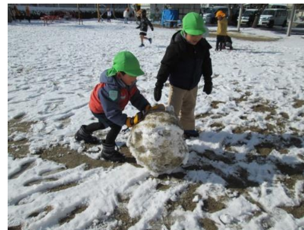
大きな雪だるまできるかな？ 大玉にすると意外と力があるんです。