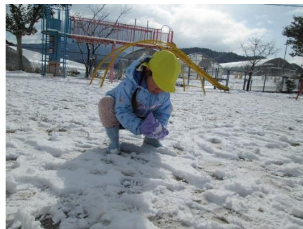
潰れないように、でも、固まるように力を 加減して雪玉作り○