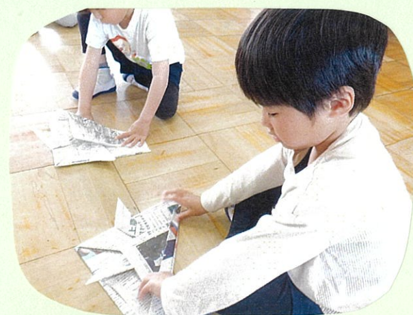
本当にかぶれる大きさの かぶとを折ったよ。