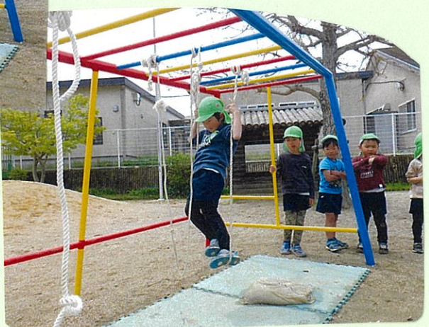
おっと...全身使います。