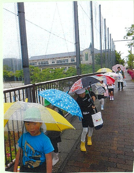
かさをさして歩くのも 練習だね。