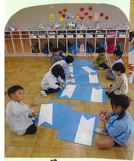
マスキングテープをはって