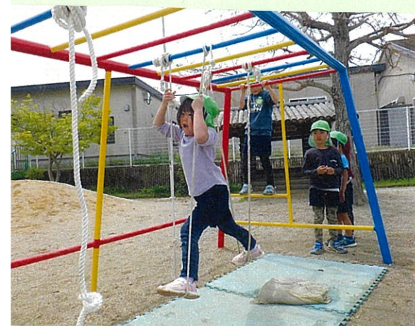
ロープ渡り ゆらゆらこわい けれど、それが 楽しいよ