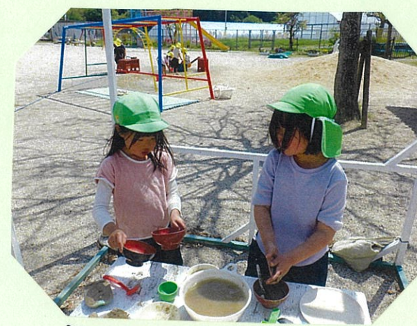
「これに入れるのどう？」 「いいこと考えた！」など 話しながら遊んでいます。