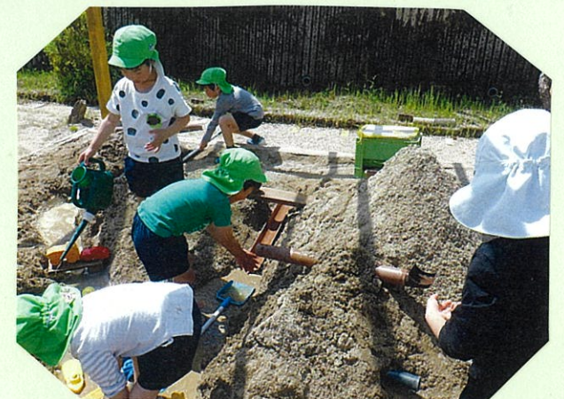
砂場は山と水路がどんどん 進化中!!