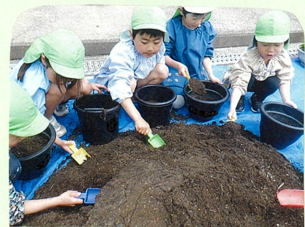
夏野菜を植えるために、自分で土を 入れて...