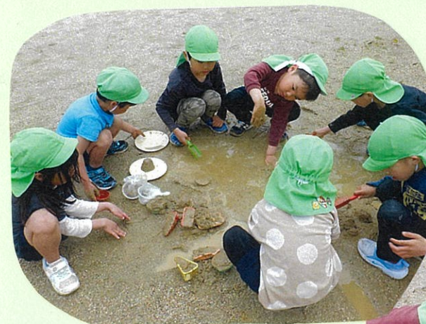
雨がバツは、園庭に 水たまり。 気持ちいいトトロの 泥で遊びました。