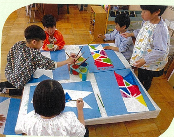
こいのぼりに色を つけて、素敵になりました☆