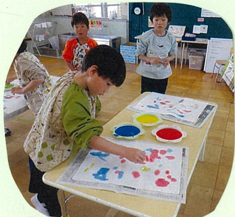
絵の具がにじんでいくのが おもしろい!!