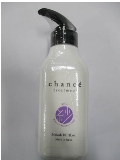
(14) シャンセ トリートメント 紗