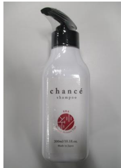
(13) シャンセ シャンプー 紗