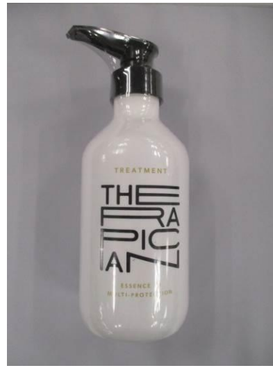
(11) Therapician Treatment