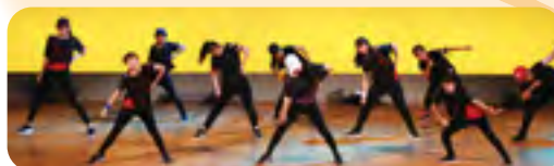
↑伊香立中学校ダンス部のみなさんのパフォーマンス