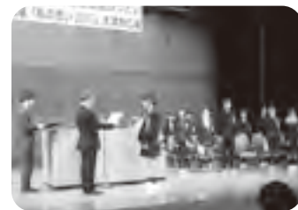
昨年の中学生広場の様子