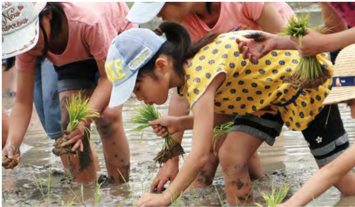
青少年ほのぼの・いきいき写真コンクール ゴールド作品「田植え」

大津市青少年育成市民会議だより 第25号 2018年10月1日 発行 発行 大津市青少年育成市民会議 編集 広報委員会 事務局 大津市役所 文化・青少年課内 Tel 528-2706