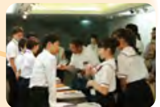
↑大津市内の中学生実行委員が運営を担当しました。