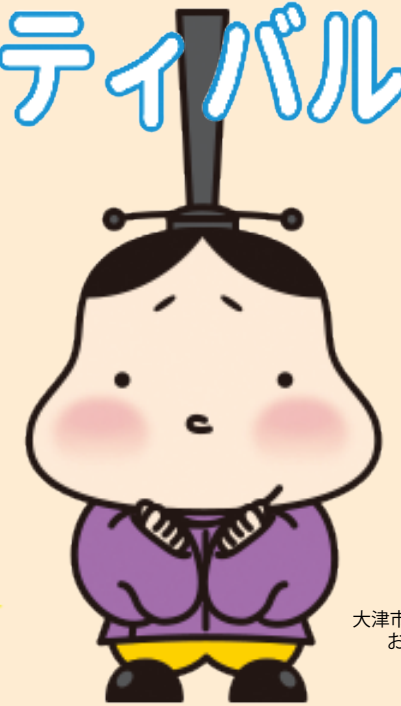
大津市観光キャラクター おおつ光ルくん