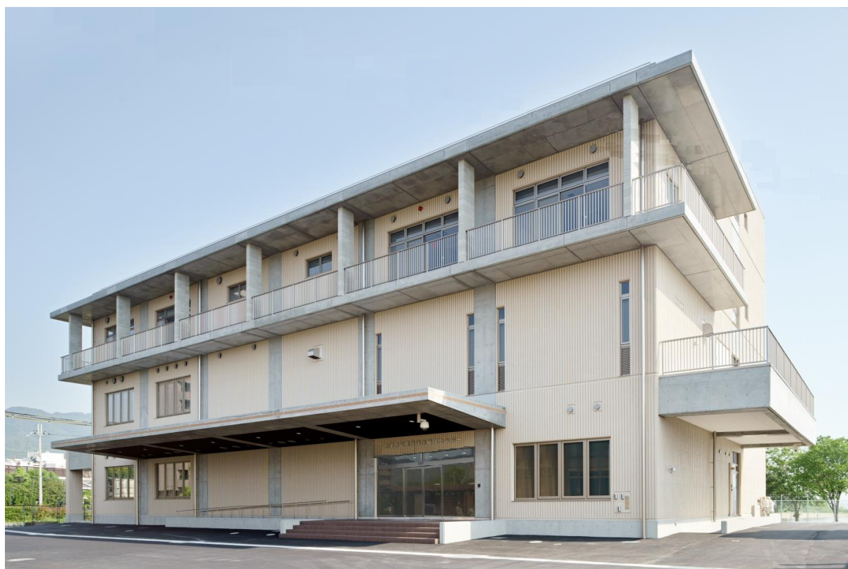
浄水管理センター