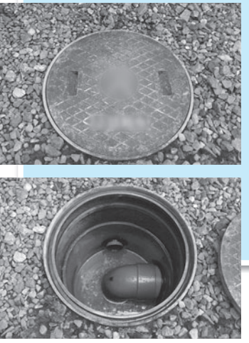
◀防臭ますの一例(上:外蓋、下:内側)

貴重なご意見・ご質問をありがとうございました! これからも皆様のご意見・ご質問をパイプライン編集委員一同お待ちしております!