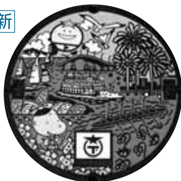
大津市制100周年記念 マンホールふた リニューアル (飛跳ねまん蔵)