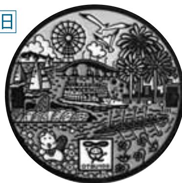
大津市制100周年記念 マンホールふた