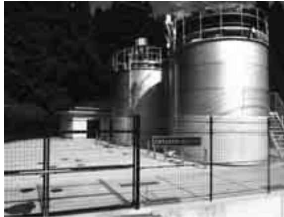
途中配水池・葛川加圧施設 (伊香立途中町)