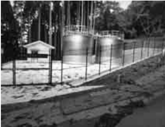
坂下配水池 (葛川坂下町)

企業局では、お客さまへ安定して給水を行えるよう、平成24年度から葛川地区の2つの簡易水道を上水道に統合する事業を実施してまいりました。このうち、坂下簡易水道においては、整備が完了し、平成27年12月に上水道へ統合しました。 葛川簡易水道につきましても、平成28年8月に上水道へ統合できるよう、引き続き整備をすすめてまいります。