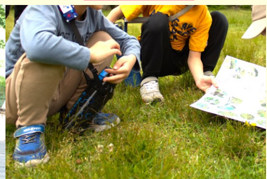
おそとでトレジャーハンティング