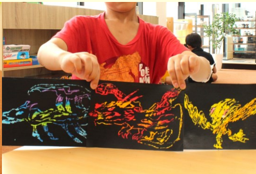
スクラッチアート