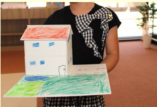
建築士さんと一緒に建築模型作り