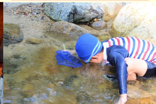
なつのミライブラリキャンプ (1泊2日・もりたんけん・かわあそび・キャンプファイヤー等)