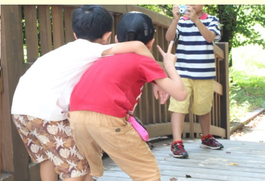
プロカメラマンと撮影ウォーク