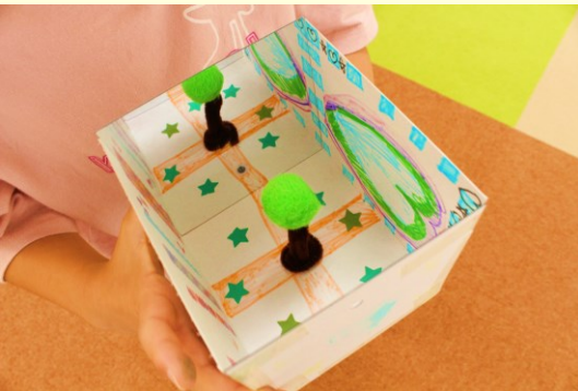
ミラーボックス工作

ミライブラリは、子どもたちに充実した、たのしい放課後を過ごしてもらえるよう、そしてあそびから生まれる多様な成長のきっかけを、より豊かなものにできるように、放課後の時間に年間約200種類の体験型プログラムを実施しています。