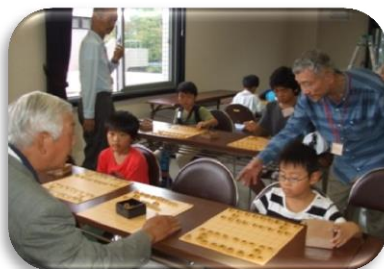
おいであそぼ 堅将会