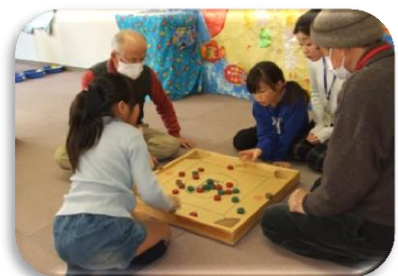
おいであそぼ in 2019