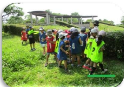
アタックキッズ(衣川緑地公園)