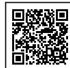
違反対象物公表制度